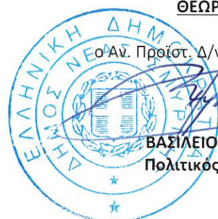
ΒΑΣΙΛΕΙΟΣ ΠΑΤΡΙΑΝΑΚΟΣ Πολιτικός Μηχανικός Π.Ε.